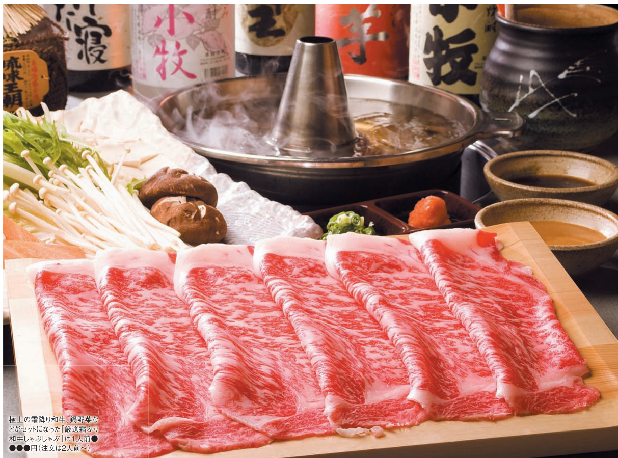
極上の霜降り和牛、鍋野菜などがセットになった「厳選霜ふり和牛しゃぶしゃぶ」は1人前 ●●●●円(注文は2人前～)